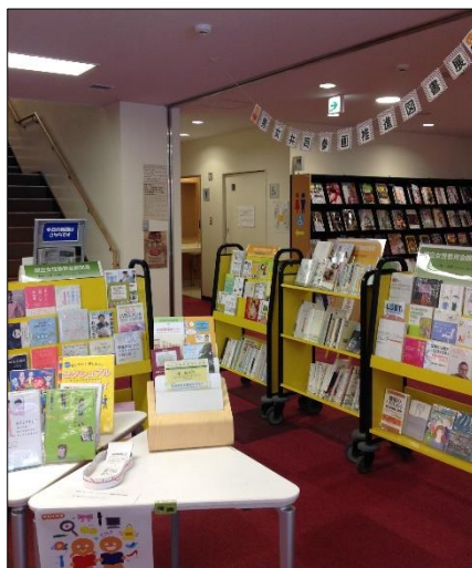
男女共同参画推進図書展 (11~2月)