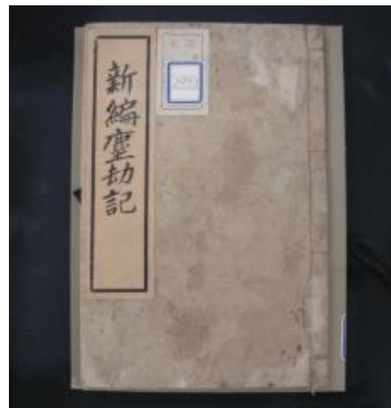
新編塵劫記 今野謙三郎編 伊勢安右衛門(仙台) 明治16(1883)年刊