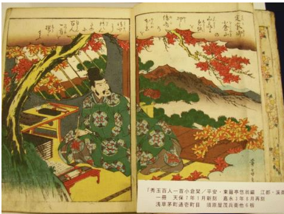
秀玉百人一首小倉葉 平安・東籬亭悠翁編 江都・溪斎英泉画 天保7(1836)年1月新刻 嘉永3(1850)年8月