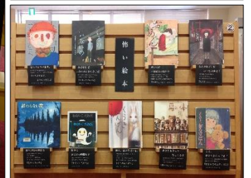
職員による企画展示 (通年)